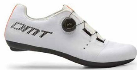
KR4 · WHITE