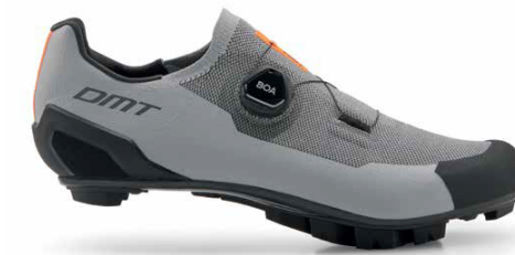
KM30 · GREY/BLACK