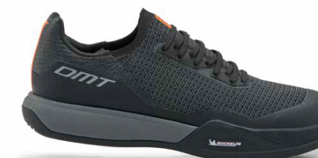
FK10 · ANTRACITE/BLACK