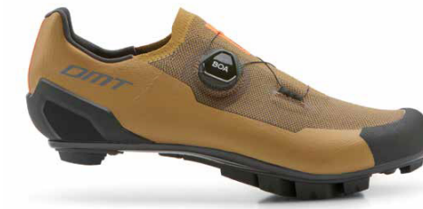
KM30 · CAMEL/BLACK