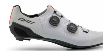
SH10 · WHITE/BLACK