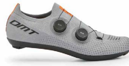
KR0 · GREY/BLACK