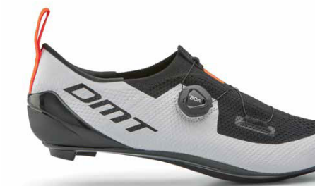
KT1 · WHITE/BLACK