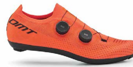
KR0 · CORAL/BLACK