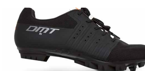
KM4 PJ · BLACK/WHITE