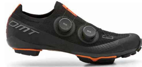
KM0 · BLACK/BLACK