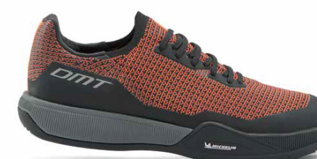
FK10 · CORAL/BLACK