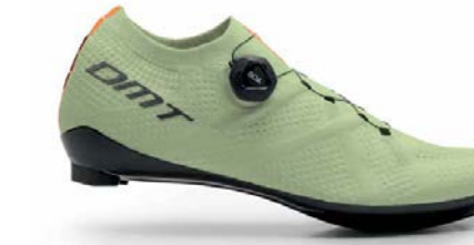
KR1 · MILKY MINT