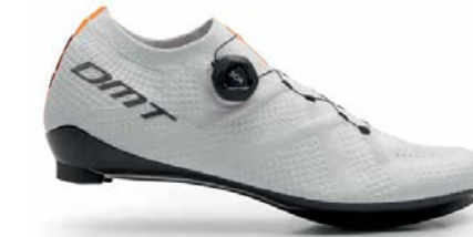
KR1 · WHITE/WHITE