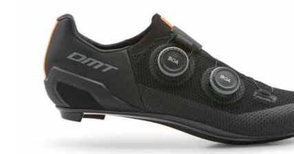
SH10 · BLACK/BLACK