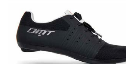
KR4 PJ · BLACK/WHITE