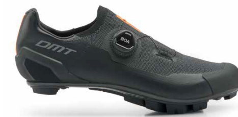
KM30 · BLACK/BLACK