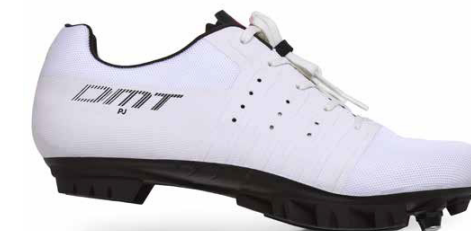
KM4 PJ · WHITE/BLACK