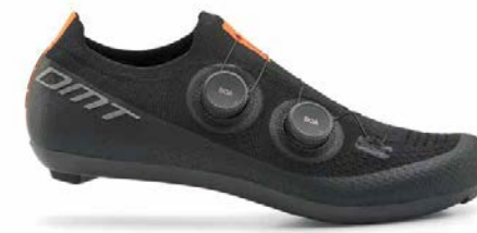
KR0 · BLACK/BLACK