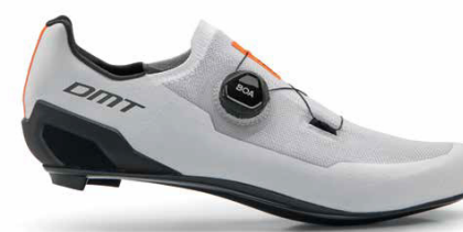
KR30 · WHITE/BLACK