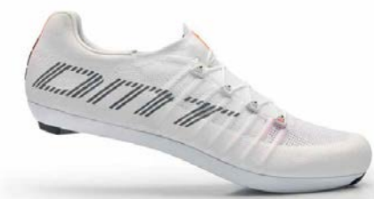
POGI'S · WHITE