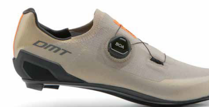
KR30 · SAND/BLACK