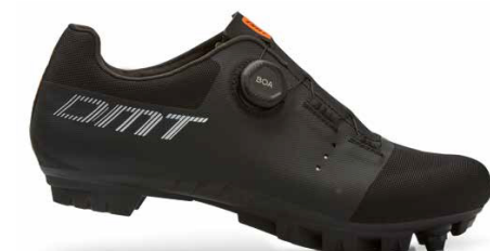
KM4 · BLACK