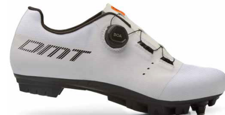
KM4 · WHITE