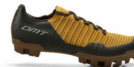
GK1 · BLACK/OCRA