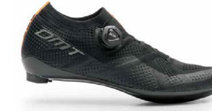
KR1 · BLACK/BLACK