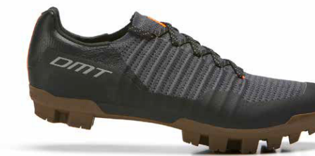
GK1 · BLACK/ANTHRACITE