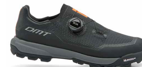
TK10 · ANTRACITE/BLACK