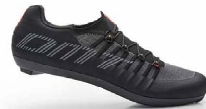
POGI'S · BLACK/GREY