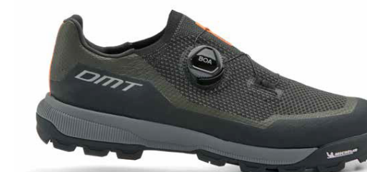
TK10 · GREEN/BLACK