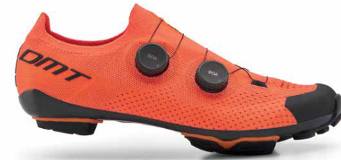
KM0 · CORAL/BLACK