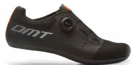
KR4 · BLACK