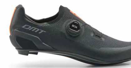
KR30 · BLACK/BLACK