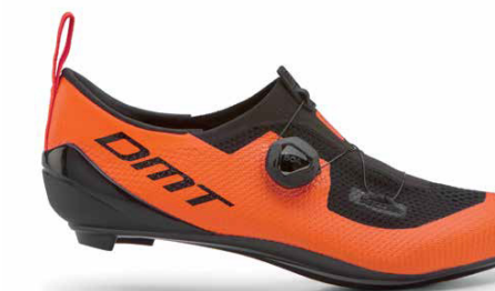
KT1 · ORANGE/BLACK