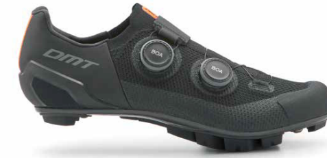
MH10 · BLACK/BLACK