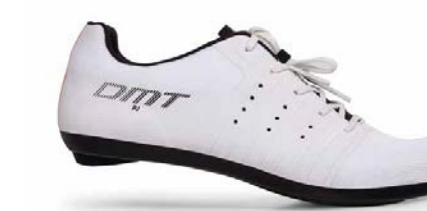
KR4 PJ · WHITE/BLACK