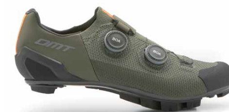
MH10 · GREEN/BLACK