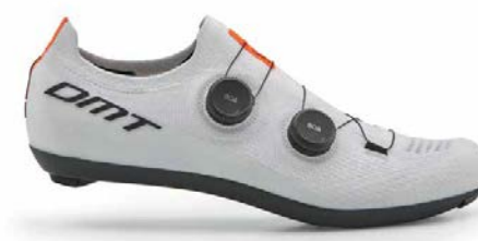
KR0 · WHITE/BLACK