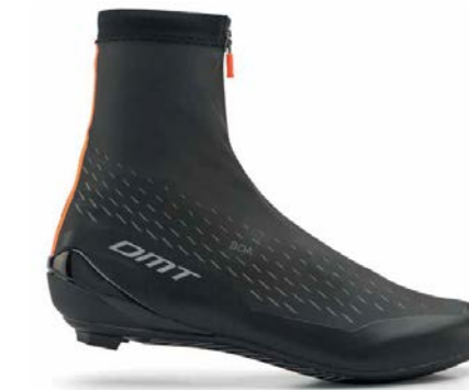
WKR1 · BLACK ORANGE