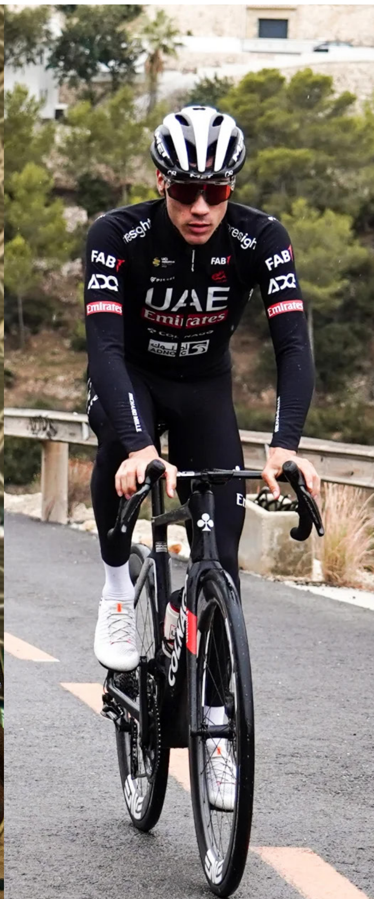
JUAN AYUSO PESQUERA