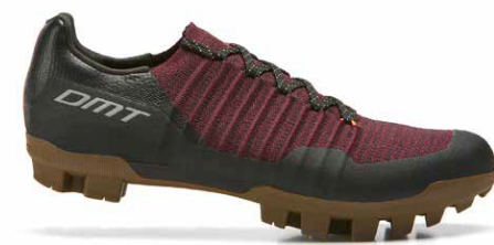
GK1 · BLACK/BORDEAUX