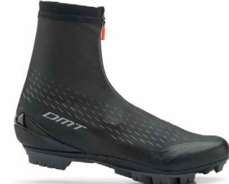
WKM1 · BLACK/ORANGE